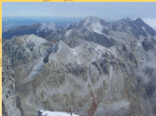
Pohled z Gerlachovského štítu 2.655m. Nejvyšší vrchol Tater a Karpatkého oblouku

Totéž najdete i v Tatrách západních, do kterých patří Roháče. Ty jsou mnohými označovány za to nejkrásnější z Tater. Nízké Tatry mají také svůj vlastní styl, mě však nejvíce uchvátily Tatry Vysoké.