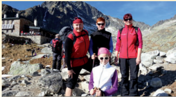
Téryho Chata 2.015 m

Jako první „seznamovací“ trek rád s přáteli realizuji chodník na Popradské pleso, kde se dá pěkně posedět, dát nějaký ten dost předraženy párek /tu hospodu nemám moc rád/, pivo a po malém odpočinku se dál vydat na Chatu pod Rysmi. Cesta na pleso trvá asi hodku a půl. Na Chatě pod Rysmi je člověk za další 2 a lze si vyzkoušet i miniferratku, která tvoří asi 100 metrů cesty. Zdatnější mohou vyzkoušet nějakou tu vynášku. Na hoře odměna, jakou si člověk vybere. Většinou čaj /opravdu skvělý/, rum nebo pivo. Na chatě se dá i přespat. Myslím, že většina lidí takové ticho, tmu a nebe plné hvězd už dlouho nezažila. Přes sedlo na vrchol 2.499 m je to asi ještě hodka a každopádně stojí za to. Rysy jsou totiž nejvyšší horou Polska a jsou od tam dost úžasné výhledy úplně všude.