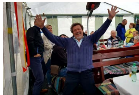
Radost řidiče autobusu, když zjistil, že zpátky do Štěpánkovic jedeme ...autobusem :)